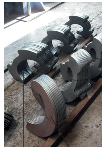
GIRO DERECHA GIRO IZQUIERDA